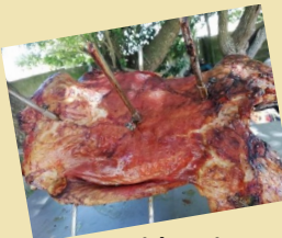
HD Spitbraai - 073 622 0442